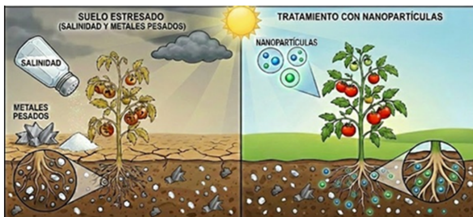
Figura 1. Esquema comparativo conceptual de plantas cultivadas en suelos con salinidad y presencia de plomo. A la izquierda se muestra una planta sin nanopartículas, con disminución en crecimiento y calidad del fruto; a la derecha, una planta bajo las mismas condiciones con aplicación de nanopartículas, se ilustra una posible mitigación del estrés. Imagen generada con Inteligencia Artificial. ChatGPT, OpenAI, 2026 para fines ilustrativos y de divulgación científica, no basada en datos experimentales reales.

Es importante destacar que estas tecnologías aún se encuentran en fase de investigación y que sus posibles efectos ambientales y sociales deben evaluarse cuidadosamente antes de su aplicación a gran escala. Sus beneficios dependen de un uso adecuado, pues la dosis, el tipo de nanopartícula y el cultivo determinan los resultados [12].